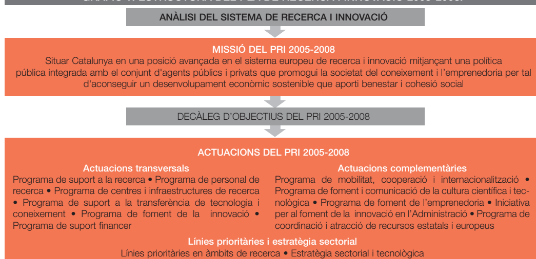
GRÀFIC 1. ESTRUCTURA DEL PLA DE RECERCA I INNOVACIÓ 2005-2008.

Les actuacions complementàries tenen com a finalitat generar un entorn que potenciï la cultura de la ciència, la tecnologia i la innovació en tots els àmbits de la societat, així com el sorgiment i la projecció d'iniciatives innovadores.